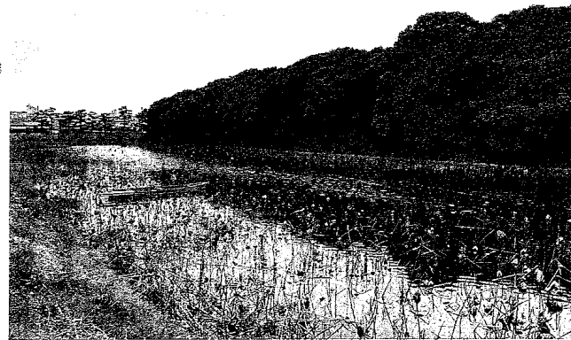
岡ミサンザイ古墳(仲哀天皇陵)

申込問合せ先：藤井寺市観光協会 電話 939-7047 申込期間：平成20年6月2日(月)～6月27日(金) 人数：各100名 (午前の部・午後の部別にお申し込み下さい) 定員になり次第締め切ります