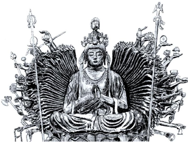
十一面千手千眼観世音菩薩