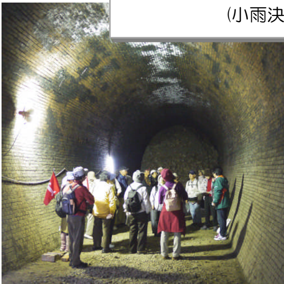
亀の瀬トンネル見学